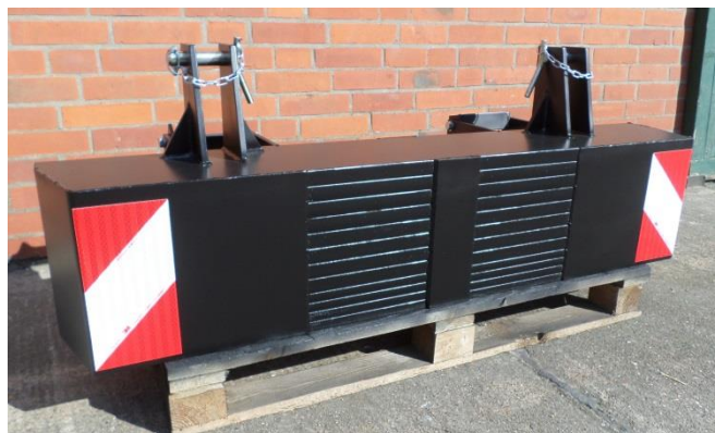
UNIMASS FSG 950 kg

Das Gewicht ist aus einzelnen Stahlplatten aufgebaut und kann hierdurch in relativ kleinen Gewichtsabstufungen auf die Kundenwünsche angepasst werden. Darüber hinaus besteht die Möglichkeit weitere Stahlplatten mit Bohrungen zu versehen und bei Bedarf von unten an das Gewicht zu schrauben.