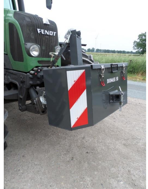
DUOMASS SB 650 kg Standard

Die DUOMASS SB Standard sind mit einer Kat 3 Unterlenkerachse sowie einer 49kN Rangier- und Zugkupplung ausgerüstet.