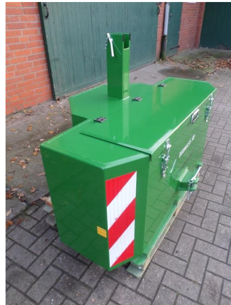
1.100 kg mit Kiste 110x35x45cm

Auf Wunsch kann für das DUOMASS SB auch mit einem Zusatzgewicht ausgerüstet werden. Dieses wird auf den Kistenteil vor der Oberlenkersäule aufgelegt.