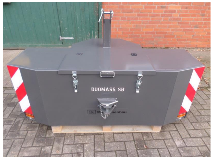
Kiste: 80x32x28cm, spritzwassergeschützt, abschließbar